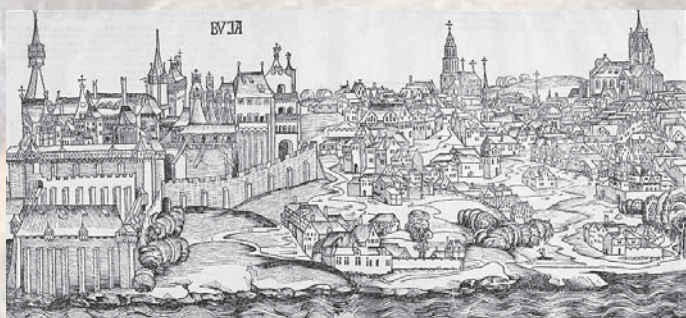
BUDA KORABELI ÁBRÁZOLÁSA

A magyar romantika már korán felfedezte magának Török Bálint történetét, Arany János meg is verselte az eseményeket, Gárdonyi pedig e hagyományt követve tette meg halhatatlan műve egyik, a magyar fátumot megszemélyesítő mel-