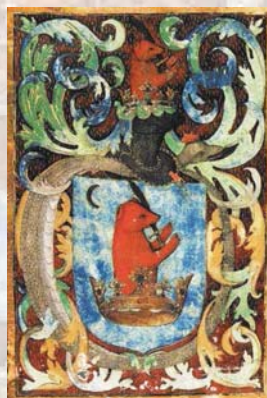
AZ ENYINGI TÖRÖK CSALÁD CÍMERE