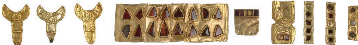
AZ ÜSZÖGPUSZTÁN FELTÁRT FEJEDELMI SÍRLELET NÉHÁNY BECES DARABJA