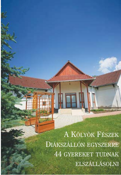
A KÖLYÖK FÉSZEK DIÁKSZALLÓN EGYSZERRE 44 GYEREKET TUDNAK ELSZÁLLÁSOLNI