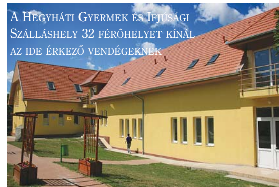
A HEGYHÁTI GYERMEK ÉS IFJÚSÁGI SZÁLLÁSHELY 32 FÉRŐHELYET KÍNÁL AZ IDE ÉRKEZŐ VENDÉGEKNEK

A Vendégház épületében található a Rendezvény- és Konferenciaközpont, mely különálló vizesblokkal és büféhelyiséggel szolgálja az ide érkezőket. A rendezvényterem 100 fő befogadására alkalmas.