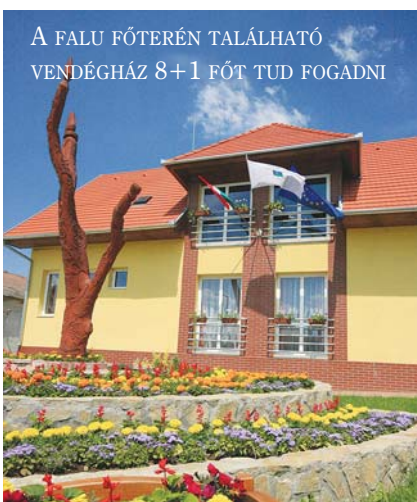
A FALU FŐTERÉN TALÁLHATÓ VENDÉGHÁZ 8+1 FŐT TUD FOGADNI

Negyven darab kerékpár várja a túrázás szerelmeseit, a vízi kalandok kedvelői tíz darab háromszemélyes kenuval indulhatnak a tavak élővilágának felfedezésére. Gyermekbarát, árnyas játszóterünkön az egyedi fafaragású játékok között biztonságban játszhatnak a legkisebbek is.