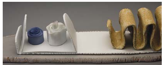
KÍGYÓ A KERTBEN – RÉSZLET, 2009

– Mindegyiket nagyon szerettem, s miután ipari formatervezőnek készültem, nagy elhivatottság munkált bennem, hogy részt vegyek a tömegtermelésben. A diplomamunkám is egy edénykészlet volt. Hollóházának használati tárgyakat és díszműveket terveztem, Herendnek többek közt olyan határozatos kávékészletet, melynek minden csészéje más formájú a háromtól nyolcszögletűig, ugyanakkora úrtartalom mellett. Teljesen szabad kezet kaptam egy sakk-készlet tervezéséhez is, ami igazi örömmunka volt. Beleástam magam e játék történetébe. A táblája és a figurái is a herendire jellemző áttört porcelánok, elképzelhető, milyen óriási mennyiségű emberi munka van benne. Horribilis az ára is, de arab sejtek időnként rendelnek belőle. Szívemnek nagyon kedves a Zsolnaynak megálmodott eozin fali virág sorozatom, melynek három eleme a virágbimbó, a kecsesen kígyózó tulipán és a levegőszerűen széttáruló szegfű. Szólóban is megállják a helyüket, de nagyobb felületet is lehet velük díszíteni ugyanannak a formának a különböző méretű és festésű darabjai.