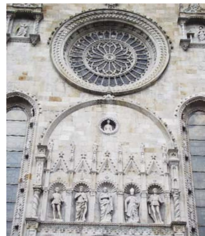
A COMÓI DÓM HOMLOKZATA

– Én örömmel lelem benne. Sokszor mutathatom be városunk nevezetességeit a Pécsre látogató hírességeknek. Egy NATO-főtisztár ittlétekor a lezárt Sétatéren, civil ruhás biztonsági őrök kíséretében jártuk végig a világörökségi helyszíneket, de én lehettem a kísérője Plácido Domingónak is. Őt különösen a székesegyház nyűgözte le, kérte is, hadd imádkozhasson egyedül, így pár percre elvonult a Corpus Christi-kápolnába. Külföldieket azért jó kalauzolni, mert mást vesznek észre, mint az itt élők. S egy tízéves gyerek ugyanolyan fontos, ha múzeumi közegben jár, mint bármely híresség. Sőt, ha egy 30 fős