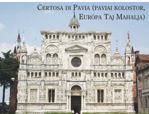
CERTOSA DI PAVIA (PAVIAI KOLOSTOR, EURÓPA TAJ MAHALJA)