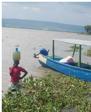
VÍZHORDÁS A VIKTÓRIA-TÓRÓL

– Szörnyű volt, megrázó. Két hetet töltöttem egy nyolcezer fős menekülttáborban, a sziget keleti oldalán, ahol egy kilométernyire zúdult be a víz, s már az első hullámban tízezeren meghaltak.