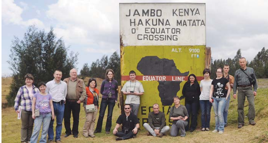
„ÁTKELÉS” AZ EGYENLÍTŐN

volt látni azt a gyermeket, akinek deréktól lefelé lejtött a bőre, mert az anyja nem nézte meg, milyen forró vízbe teszi. És amikor egy baleset után a teherautó platójára zsúfolt emberhalomból kellett éjnek évadján kiválogatni a halottak közül a még ellátandókat...! Persze, a kigyómarás is lehet végzetes.