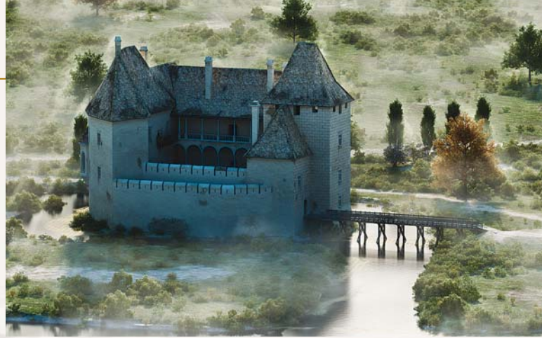
A SIMONTORNyai Vár 16. századi rekonstrukciós rajza

K i ne emlékezne nosztalgiával gyermekora egyik kedvenc nyalánkságára, a magyar várak képeivel díszített, kicsiny szerencsi csokoládéakra? Hányan vágtak bele csak ezért hazai vártúrába, hogy élőben is láthassák Sárospatak jellegzetes tornyát, Gyula téglából épült masszív falait, vagy éppen a Tenkes kapitánya által is bevett Siklós kapuját. Sajnos Simontornya kimaradt ebből a reklámból, pedig ezzel a várkastéllyal is érdemes közelebbről megismerkednünk.