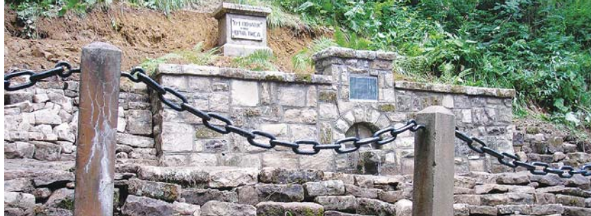
A NAGY KIHÍVÁS – A FEKETE-TISZA FORRÁSA UKRAJNÁBAN

tek, szakosztályok, magánemberek vállalnak források felett védnökséget. Ez azt jelenti, hogy évente legalább két alkalommal felkeresik, kitisztítják a pártfogásukba vett forrásokat. Az utóbbi időig több mint ötven forrás talált gazdára. Az elmúlt öt esztendőben a kiépített források vízhozamát, hőmérsékletét évente több alkalommal megmértük, és naplóban rögzítettük az adatokat, így elmondható, hogy pontos és naprakész információkkal rendelkezünk. Forrásainkat az ÁNTSZ szakembereivel is bevizsgáljuk, és a mérések alapján állíthatom, hogy néhány kivételtől eltekintve forrásaink vízminősége kiváló.