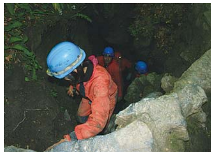
ÚJRA A FELSZÍNEN