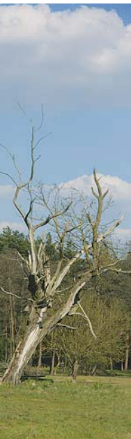
PIHENŐ ÉS ESŐBEÁLLÓ A 9-ES TÓNÁL. GÉMESKÚT A HOMOKGYEP LEGELŐJÉN. MOCSÁR ÁLLJA UTUNKAT. VIDÁM ÁTKELÉS A LÁPON.