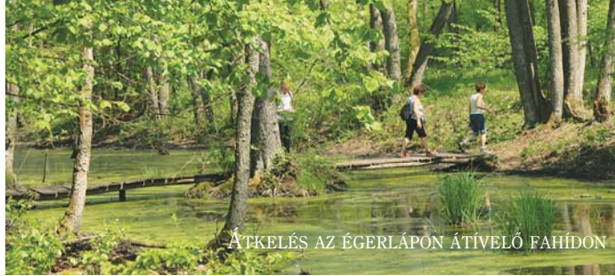
ÁTKELÉS AZ ÉGERLÁPON ÁTIVELŐ FAHÍDON