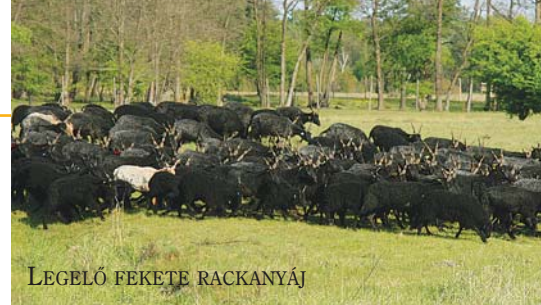
LEGELŐ FEKETE RACKANYÁJ